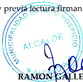
RAMON GALLEGUILLOS CASTILLO ALCALDE MUNICIPALIDAD DE ALTO HOSPICIO